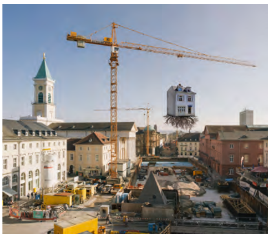
Leandro Erlich, Pulled by the Roots , 2015, Außeninstallation mit Kran, verschiedene Materialien, Karlsruhe, © Werk, Visualisierung: Leandro Erlich Studio

Das zentrale Kunstwerk der Ausstellung Die Stadt ist der Star stellt die Großinstallation Pulled by the Roots des argentinischen Künstlers Leandro Erlich dar. Direkt am Marktplatz steht ein großer Baukran, der eine ungewöhnliche Last trägt: An seinen Stahlseilen hängt in luftiger Höhe ein ganzes Haus! Architektonisch einem historischen Gebäude des Architekten Friedrich Weinbrenner nachempfunden, scheint der Bau mitsamt seinem massiven Wurzelwerk buchstäblich aus einer der nahegelegenen Häuserreihen herausgerissen. Erlich, der weltweit für seine hyperrealen Skulpturen und Installationen bekannt ist, greift mit dem Werk auf unmissverständliche Weise globale Themen wie Entwurzelung, Migration oder Simulation auf. Im Kontext der Baumaßnahmen in der Karlsruher Innenstadt verwendet er mit dem Kran ein zentrales Werkzeug des Hoch- und Tiefbaus und fügt ihm ein irritierendes Moment hinzu, da man zunächst meinen könnte, der Kranführer habe sich vertan.