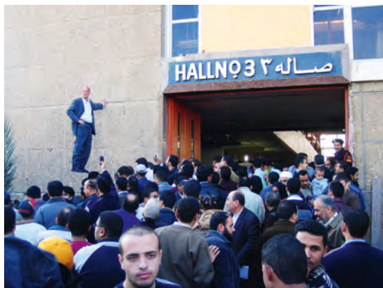
Johan Lorbeer, Still Life Performance – Tarzan/Standbein , 2007, Performance, Kairo, International Bookfair, © Werk: Johan Lorbeer, Foto: S. Hartmann

Mehrere Meter über dem Boden schwebend, vermittelt er das Bild eines schwerelosen Menschen. In seiner Performance-Serie Tarzan/Standbein berührt er lediglich mit einer Hand ein Gebäude oder eine Wand, die Schwerkraft scheint dabei außer Kraft gesetzt. In Karlsruhe wird Lorbeer durch eine Performance an einem Baucontainer PassantInnen glauben lassen, sie hätten ein Trugbild vor sich. Wer näher kommt, hat die Chance, sich vom Künstler über die Realität seiner Erscheinung aufklären zu lassen. Im Unterschied zu den BauarbeiterInnen, die in der Umgebung auf Kränen, Baggern oder Dächern in luftiger Höhe oder in den Tiefen des Erdreichs beschäftigt sind, hat Lorbeer die Zeit, mit den FußgängerInnen ein Gespräch zu führen. Aktion und Skulptur verschmelzen in seiner Performance zu einem bewegten Bild, das zum Nachdenken über die Erfahrung der Stadt, des Raums, der Baustellen oder einfach über physikalische Gesetzmäßigkeiten anregt, die hier nicht mehr zu gelten scheinen.