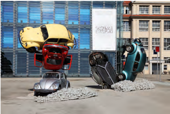
Hans Hollein, Car Building , 1960/2011, VW-Käfer, Stahl, Steine, © Werk: Hans Hollein, Foto: ZKM | Zentrum für Kunst und Medientechnologie Karlsruhe, Anatole Serexhe

Theoretiker Hans Hollein in einer seiner zahlreichen Publikationen. Folgerichtig ersetzte er im Entwurf zu seiner zweiteiligen Skulptur Car Building die üblichen Baumaterialien durch Autos. Fünf verschiedenfarbige VW-Käfer, aufeinandergestapelt und polyaxial gedreht, ringen um ihr Gleichgewicht. 2011 erstmals für die Ausstellung Car Culture. Medien der Mobilität im ZKM | Karlsruhe realisiert, wird die Arbeit im Rahmen von Die Stadt ist der Star vor dem »K.« in der Karlsruher Innenstadt präsentiert. Angesichts der Baumaßnahmen an der zentralen Verkehrsachse scheint es, als ob die VW-Käfer aus funktionalen Gründen von der Straße auf den Gehweg neben den Informationspavillon geschoben worden wären – ein passendes Bild für die Umleitung des Verkehrs. Auch dieses Werk irritiert, verunsichert und wirkt wie eine surreale Note im Alltagsgeschehen.