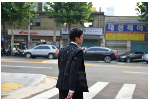
Shinseungback Kimyonghun, Aposematic Jacket , 2014, Performance, Jacke, Kameras, © Werk

Das südkoreanische Künstlerduo Shinseungback Kimyonghun führt mit einem ungewöhnlichen Kleidungsstück die Überwachungsmaßnahmen im öffentlichen Raum ad absurdum. Die von ihnen entwickelte Jacke ist mit zahlreichen Webcams ausgestattet, die das Geschehen im öffentlichen Raum auf Knopfdruck im 360-Grad-Rundumblick filmen und ins Internet übertragen können. Wer die Aposematic Jacket trägt, kann sich bei Gefahr vor potenziellen Angreifern durch die Aussendung des Warnsignals »I can record you« schützen. Der Besitzer dieses warnenden Kleidungsstücks ist demzufolge nicht länger Opfer der im Stadtraum präsenten Überwachungskameras, sondern in der Position, mittels Videoaufnahmen selbst Macht auf sein Umfeld auszuüben – vergleichbar mit Nationen, Stadtbehörden oder Unternehmen wie Google. Die BesucherInnen und KarlsruherInnen haben die Gelegenheit, an ausgewählten Tagen in der Innenstadt einer Person mit dieser Jacke zu begegnen, bevor Aposematic Jacket dann ab dem 18.09.2015 Exponat der Ausstellung Global Control and Censorship im ZKM | Karlsruhe wird.