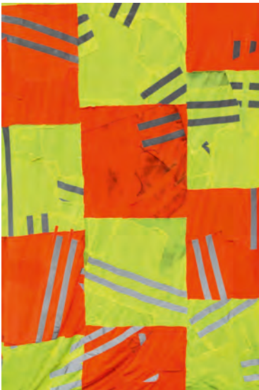
Wermke/Leinkauf, Landmarks (Detail) , 2013 (gebrauchte Sicherheitswesten), © Werk, Foto: Wermke/Leinkauf

Das Künstlerduo Wermke/Leinkauf hat sich mit waghalsigen wie subversiven Interventionen im urbanen Raum einen Namen gemacht. In der Kluft von BaurbeiterInnen irritierten sie bereits PassantInnen mit Spaziergängen auf Brückengeländern, säuberten bei parkenden Autos die Windschutzscheiben oder zeigten sich im Handstand auf einem Rathausturm. In Karlsruhe hinterfragen die Künstler nun die Sicherheitsmaßnahmen, die mit dem Bau der U-Strab und der Neuregelung des Verkehrs einhergehen. Als visuelle Klammer für ihre performativen Eingriffe in den Stadtraum dienen Installationen mit Flaggen aus dem Stoff von Warn- und Sicherheitswesten sowie farbige Wandgestaltungen. Hinter den Gleisen am Hauptbahnhof angebracht, thematisieren die selbstgenähten Fahnen die Rolle und Funktion von Absperrungen und Verbotsschildern, die zum Schutz der BürgerInnen eingesetzt werden. Ein absurd erscheinender Bauzaun an ungewöhnlicher Stelle regt PassantInnen dazu an, Bekanntes neu zu entdecken, Konventionen auf ihren Sinn hin zu befragen und die Grenze zwischen Kunst und Alltagsgeschehen auszuloten.