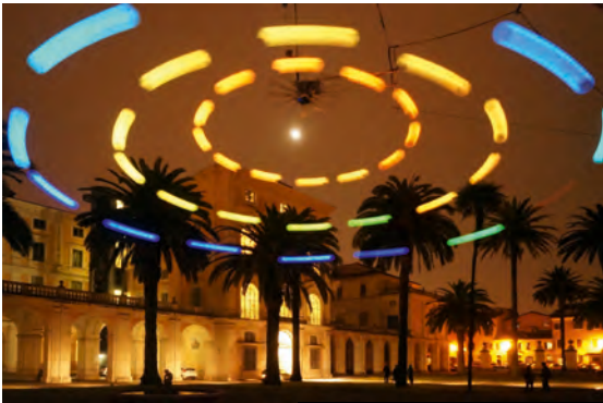
Tim Otto Roth, Heaven's Carousel , 2014, Kinetische Klang- und Lichtskulptur im Außenraum, Rom, © Werk: imachination projects

Mit dem Heaven's Carousel scheint im Herzen der Karlsruher Innenstadt vor dem Naturkundemuseum ein leuchtendes Klang-UFO gelandet zu sein, das antike Sphärenmusik unter den Vorzeichen der Astrophysik des 21. Jahrhunderts neu interpretiert. In zehn Metern Höhe schwebt an einem Kran eine luftige Karussell-Konstruktion, von der an zwölf Strängen insgesamt 36 kugelförmige, leuchtende Lautsprecher hängen. Das Heaven's Carousel hebt in den Abendstunden ab: In Rotation versetzt, drehen sich die in Leuchtkugeln integrierten Lautsprecher mit einem Durchmesser von bis zu 16 Metern über den Köpfen der BesucherInnen. Sie sind eingeladen, sich unter der Installation frei zu bewegen, um das sich kontinuierlich verändernde Klanguniversum zu erkunden. Auch wenn aus den einzelnen Lautsprechern »nur« reine Töne erklingen, so rekombinieren sich diese im Raum zu komplexen Klanggebilden. Aufgrund des Doppler-Effekts klingt dabei ein Ton höher, wenn die Klangquelle auf die BesucherInnen zufliegt, und tiefer, wenn sie sich wieder entfernt.