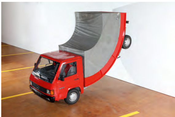
Erwin Wurm, Truck , 2011, Installation mit Lkw Mercedes-Benz MB, © Werk: Erwin Wurm, Foto: ZKM | Zentrum für Kunst und Medientechnologie Karlsruhe, Anatole Serexhe

Der österreichische Bildhauer, Video- und Aktionskünstler Erwin Wurm verformt mit Vorliebe Alltagsgegenstände. Mit seinen aufgeblasenen Häusern, verbogenen Autos und seinen partizipatorischen One Minute Sculptures hinterfragt er ironisch das Erscheinungsbild von Statussymbolen und die Bedeutung von gesellschaftlichen Konventionen. Für den Stadtgeburtstag lässt Wurm einen knallroten Lastwagen an der Wand des Weinbrennerhauses rückwärts hochfahren. In der Mitte elegant nach oben gebogen, scheint der Truck sein Gewicht mühelos zu überwinden und sich an die Form des repräsentativen Gebäudes anzupassen. Infolge seiner körperlichen Verzerrung erhält das Nutzfahrzeug skulpturalen Charakter, seine Funktion tritt hinter der artistischen Gestalt zurück. Von ihrer originären Bedeutung enthoben ist auch die Hausfassade: Von dem Lkw als Parkplatz und Straße in Anspruch genommen, erscheint die Wand weniger als Schutzhülle für einen Innenraum denn als Bühne für die Kunst.