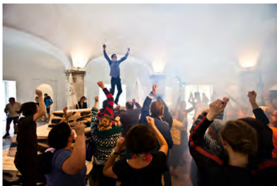
Christian Falsnaes, Influence , 2012, Performance, HD-Video, Berlin © Werk, Video Still: Christian Falsnaes, PSM

rechnen, in das künstlerische Geschehen eingebunden zu werden. Der dänische Video- und Performancekünstler nutzt das Publikum als künstlerisches »Material«, um gesellschaftliche Konventionen und Rituale offenzulegen. Die von ihm geschaffenen Situationen sind darauf angelegt, Verhaltensnormen zu überschreiten, bieten jedoch zugleich ein kollektives Erlebnis, das den Beteiligten nicht selten auch Spaß macht. Singen, Tanzen, Küssen sind nur einige der Aktionen, zu denen der Künstler mit Mikrofon, Lautsprechern oder durch einen eigens engagierten Animateur auffordert. In Karlsruhe lädt Falsnaes die BürgerInnen und BesucherInnen dazu ein, ihre Besorgungen in den Einkaufsstrassen und -passagen der Innenstadt zu unterbrechen, ihre Hemmungen zu vergessen und sich auf seine so simplen wie absurden Handlungsanweisungen einzulassen, denn: »A Good Reason Is One That Looks Like One«.